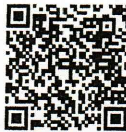
QR Code สรุปสาระสำคัญ