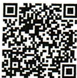
QR Code ร่างพระราชบัญญัติควบคุมการจัดมหรสพ ที่มีการใช้เครื่องขยายเสียง พ.ศ. ....